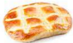
217 COCA mini crema