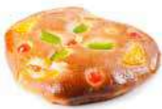
218 COCA mini fruta