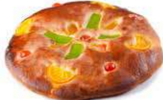
40 COCA pequeña fruta