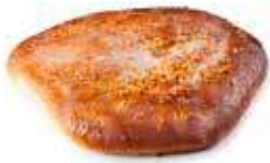
216 COCA mini almendra