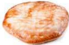
219 COCA mini cabello