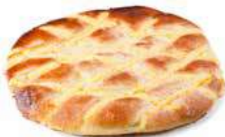
44 COCA pequeña crema