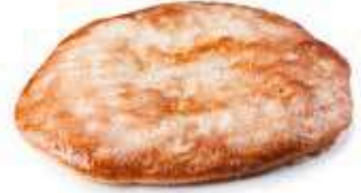
42 COCA pequeña cabello