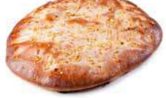
84 COCA pequeña piñón