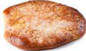
38 COCA pequeña almendra